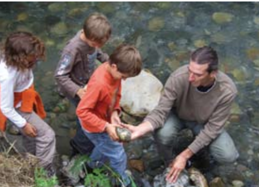
Cette année, sur les 3 journées organisées, 61 personnes ont pu profiter de cette animation avec un public allant de 5 ans à plus de 70 ans.