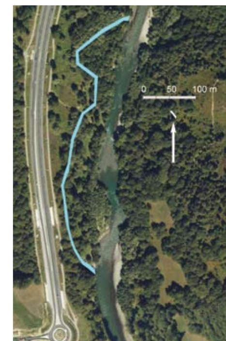
La brigade verte prévoit d'intervenir début octobre 2011, sur un bras secondaire situé en rive gauche du Gave de Pau, sur la commune d'Ayzac-Ost.