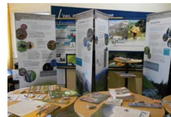
Cette vitrine des actions menées dans le cadre de Natura 2000 est destinée à tous et mise à la disposition des communes, des scolaires, des animations ponctuelles dans les salles d'exposition des vallées...

Laurence DUROT, Responsable du service Environnement du SMDRA