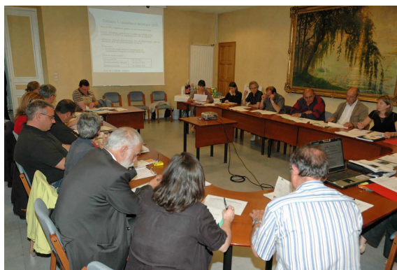
Premier comité de programmation Leader en juin 2009

Après deux ans de programmation, un premier bilan d'étape s'impose pour évaluer le fonctionnement du GAL et la mise en œuvre de sa stratégie, et pour préparer les dernières années de fonctionnement du programme qui s'achève en 2013.