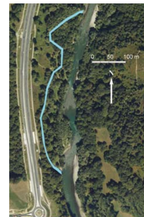
La brigade verte prévoit d'intervenir début octobre 2011, sur un bras secondaire situé en rive gauche du Gave de Pau, sur la commune d'Ayzac-Ost.