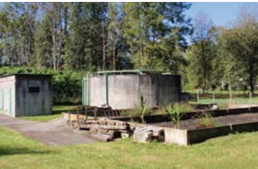
Arras-en-Lavedan et d'Arrens-Marsous entament la réhabilitation de leurs stations d'épuration et des réseaux d'assainissement.