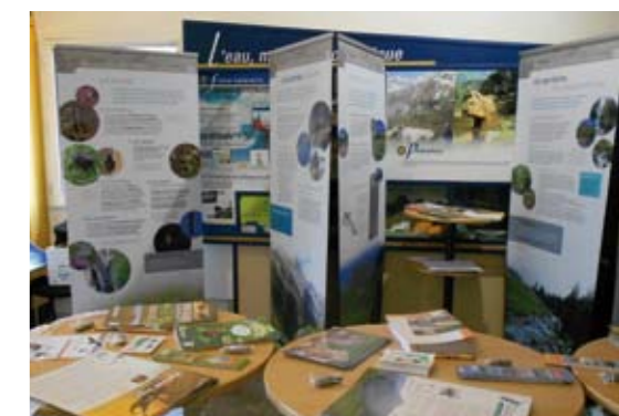
Cette vitrine des actions menées dans le cadre de Natura 2000 est destinée à tous et mise à la disposition des communes, des scolaires, des animations ponctuelles dans les salles d'exposition des vallées...

Laurence DUROT, Responsable du service Environnement du SMDRA